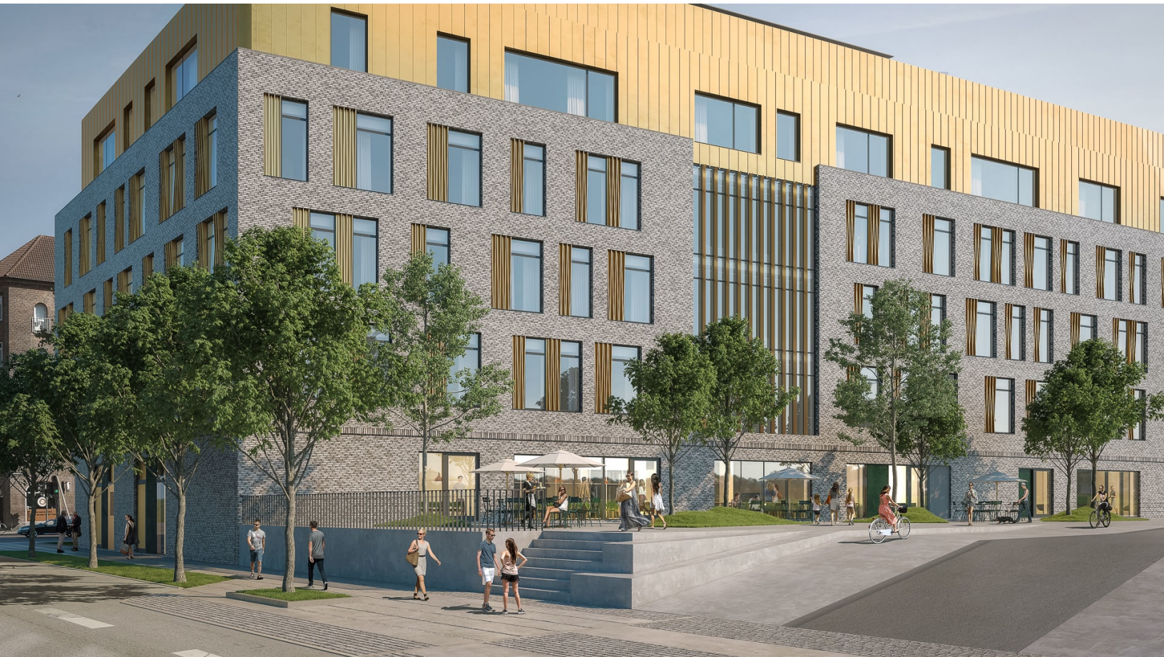
EC Hansen Hus, tegnet af Danielsen Architecture, som i 2021 bliver domicil for Visma